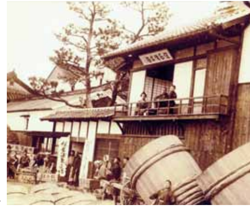
内国観業博覧会出展の記念写真(明治28年)

拝啓 青葉若葉の頃となりました。 緑が雨に洗われ、一層輝いております。 お元気で過ごしていらっしゃいますか。 日頃より弊社商品をご愛顧下さいまして心より御礼申し上げます。 この夏は、限定醸造の3年熟成“手仕事本味醂”を使った希釈用つゆが発売となります。 入江の特徴的なこってりとした甘みの極上つゆを皆様のお料理の相棒に迎えていただければ、誠に幸いに存じます。 その他にも、様々な商品を取り揃えております。新しいカタログをどうぞご覧下さいませ。 気候不順の折、どうぞご自愛くださいますよう切に願っております。 敬具 店主敬白